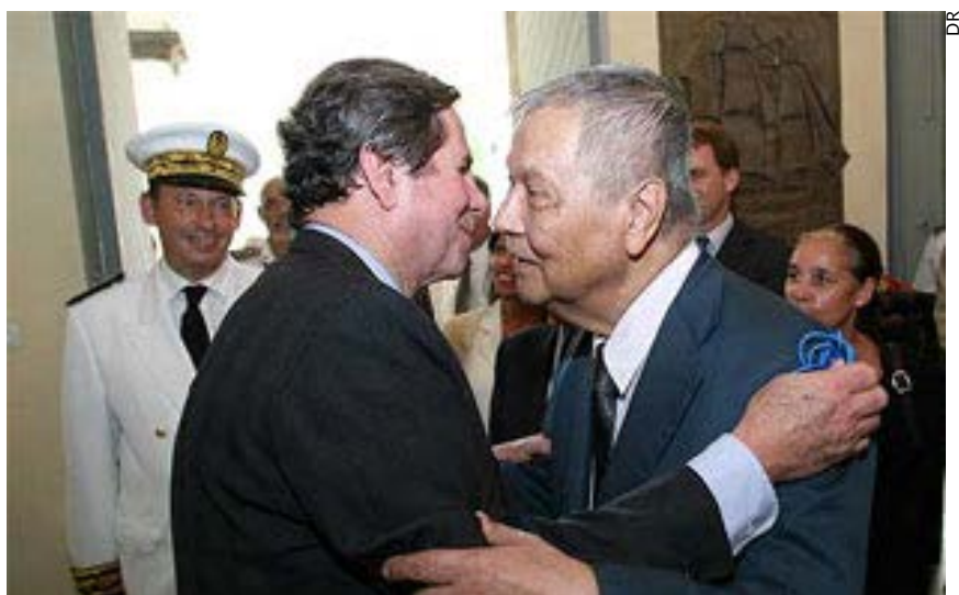
Vergès se congratulant en 2006 avec Jean-Louis Debré, l'un des fils de Michel Debré, très longtemps élu de droite de La Réunion.

et exprimer les « intérêts des Réunionnais ». Pour se faire élire, la droite n'a pas besoin d'un PCR dont l'influence est en recul permanent, d'autant que sans Vergès, qui avait une certaine aura dans l'île, le PCR ne pèse plus que par le nombre de ses voix, c'est-à-dire de moins en moins. La droite, qui dirige maintenant la région, a donc très peu de raisons de passer des accords avec le PCR, ce qui ne sera peut-être pas sans conséquence en termes de postes pour le PCR.