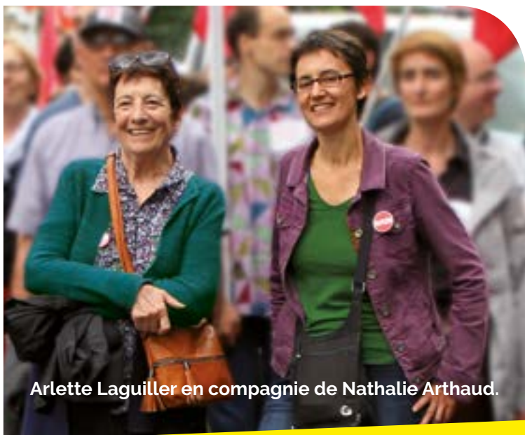
Arlette Laguiller en compagnie de Nathalie Arthaud.

Ma candidature est dans la continuité du combat qu'Arlette Laguiller mène depuis toujours avec nos camarades de Lutte ouvrière : ensemble, faisons entendre le camp des travailleurs!