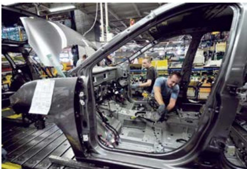
Les robots peuvent cohabiter avec le travail ouvrier (ici, chez Renault).