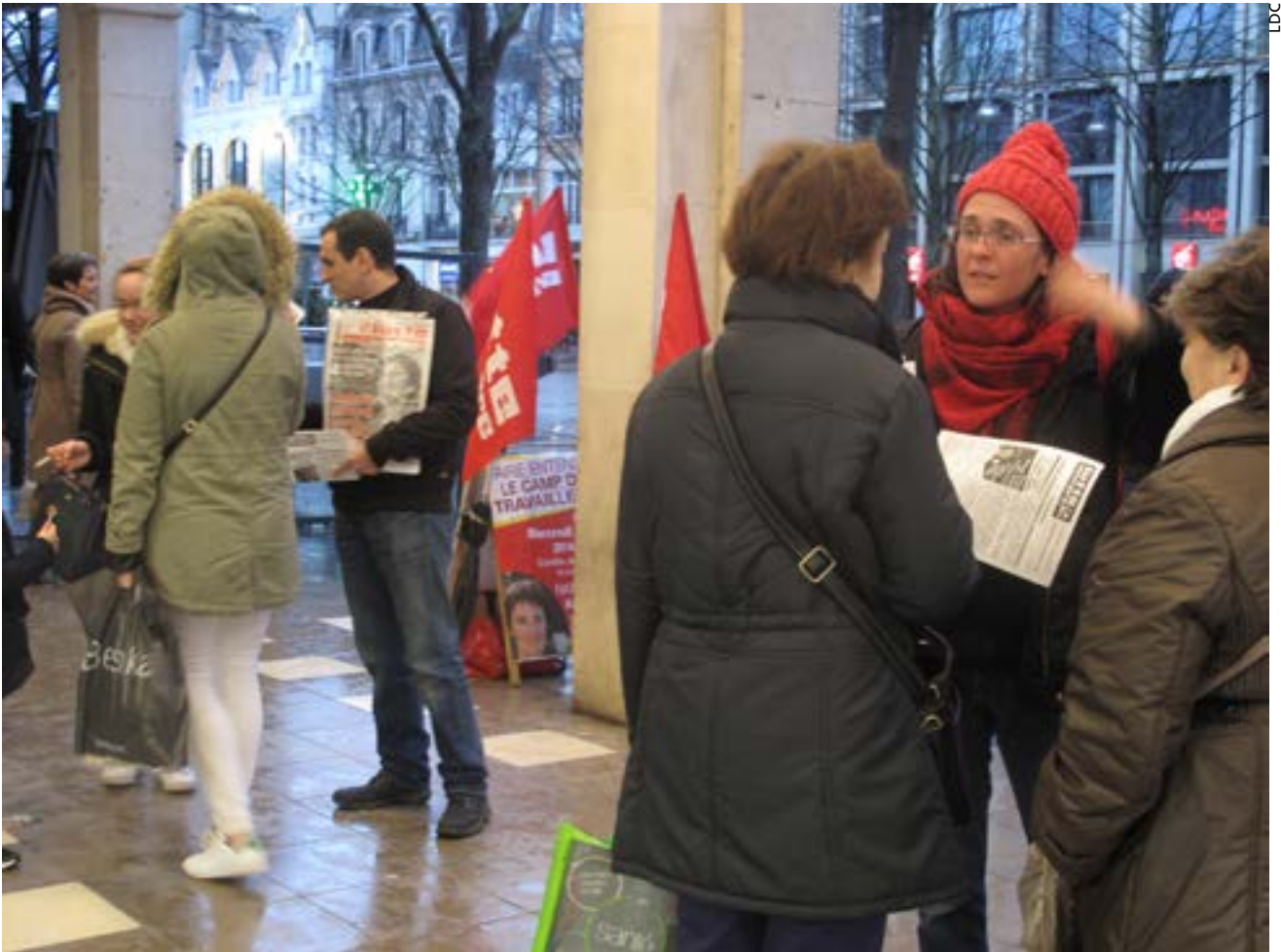
Les militants de Lutte Ouvrière en campagne à Reims.