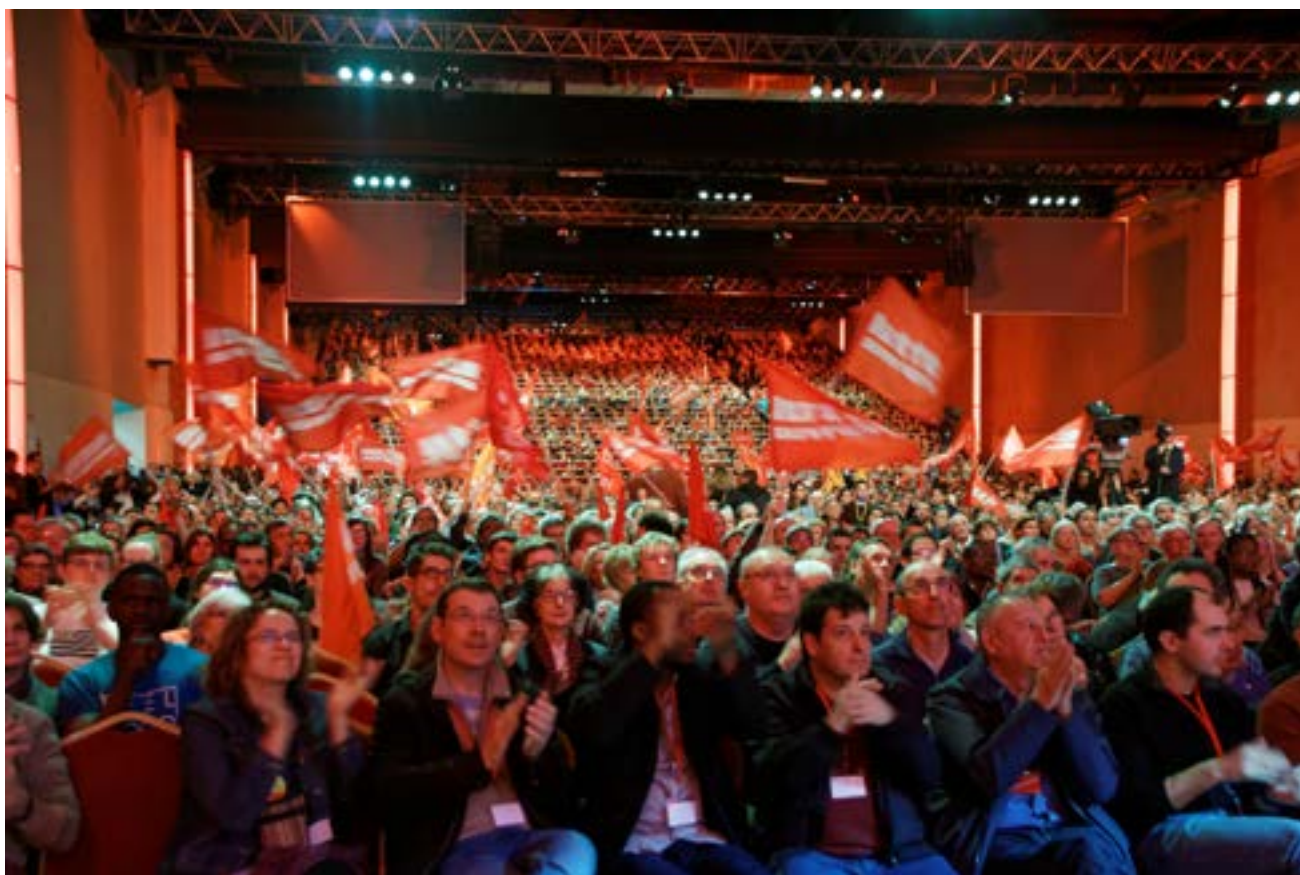
Le meeting central de Nathalie Arthaud a réuni 4 000 personnes le 26 mars à Aubervilliers.

On me répond souvent que c'est une contrainte intenable. Rendez-vous compte de la contrainte! La BNP a réalisé 7,7 milliards de bénéfices et elle procède actuellement à 675 suppressions d'emplois. Maintenir ces emplois, répartir le travail lui coûterait 27 millions par an, soit un petit 0,3 % de ses pro-