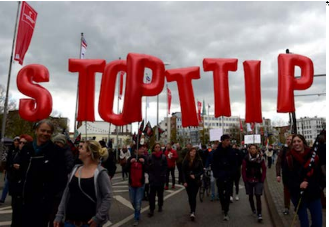
Dans plusieurs pays européens des manifestations contre le TTIP ou Tafta, ici à Hanovre en Allemagne le 23 avril 2016.

présenterait un téléphone ne fonctionnant pas dans une zone de la planète? Ces normes sont le fruit de batailles et d'accords entre multinationales. Mais le nombre élevé de domaines où chaque industriel est obligé d'adapter des produits de manière différente selon les zones de destination montre à quel point les capitalistes se servent de ces règles pour protéger leur marché.