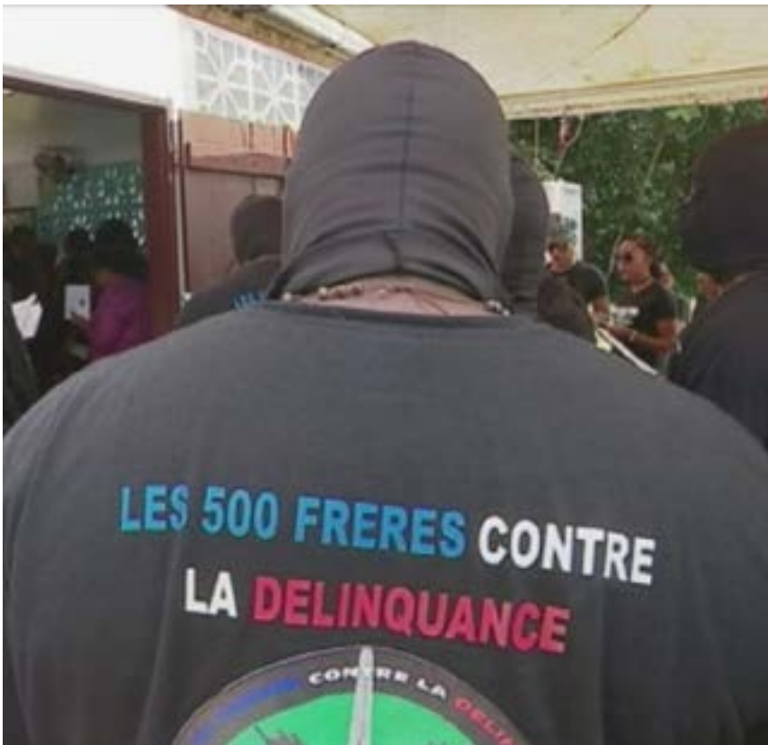
Un des 500 frères.

Aux travailleurs de faire entendre le leur ! La lutte générale en Guyane ne fait peut-être que commencer. Les travailleurs ont encore le temps de s'organiser en une force particulière, et de se manifester pour faire valoir leurs propres intérêts. Ce serait le début d'une prise de conscience de classe, indispensable pour leurs combats de l'heure et ceux de demain. La mobilisation populaire d'aujourd'hui peut en donner l'occasion aux travailleurs de Guyane.