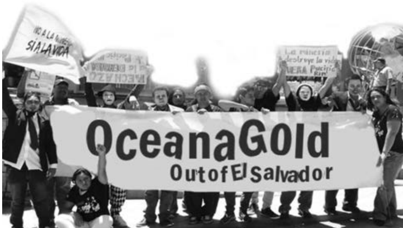
Manifestation au Salvador contre l'ouverture d'une mine d'or par l'entreprise Océanogold.

Les adversaires du Ceta réclament une autre mondialisation. Ils prétendent qu'il serait possible que les relations entre capitalistes, entre nations, ne soient pas aussi sauvages et violentes. Le plus souvent, ils se contentent d'aborder le problème à partir des pays riches, sans prendre position par