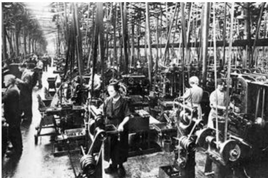
Dès l'aube du capitalisme, l'introduction des machines a accru l'exploitation.