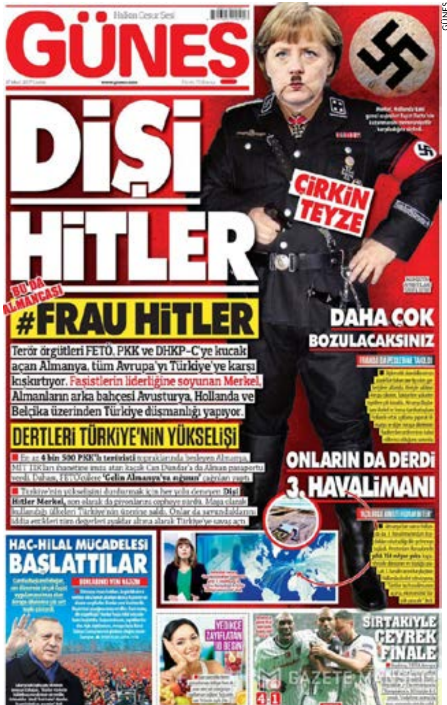
Le quotidien progouvernemental Günes représentant Angela Merkel à sa une comme un Hitler féminin.