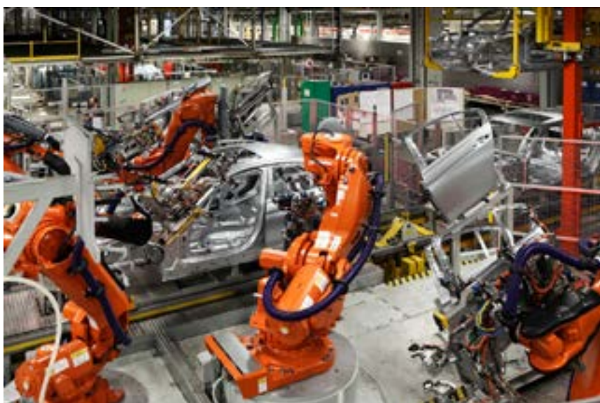
Une chaîne de soudure entièrement automatisée chez BMW.

non sans ironie, que de tels pronostics annonçant « la fin du travail » ne sont pas nouveaux. Ils ont prospéré en particulier au fur et à mesure que l'économie capitaliste plongeait des millions de travailleurs dans le chômage de masse.