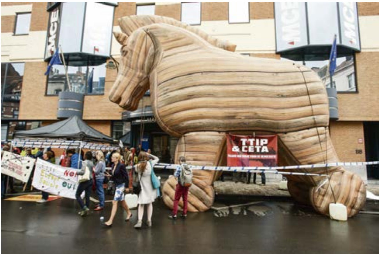
Les opposants au Ceta ont organisé une opération Cheval de Troie du 4 au 25 juin 2016 en passant dans plusieurs villes pour exprimer leurs craintes qu'il permette aux multinationales américaines d'imposer leur diktat en Europe.

tion a été faite depuis 1999 par le CERT (Canada Europe Round Table for Business: table ronde entre le Canada et l'Europe pour les affaires), réunissant un certain nombre de multinationales françaises, tels Accor, Alstom, BNP Paribas, et canadiennes, tel Bombardier. Pour ces firmes, le Ceta n'est qu'un outil de plus pour s'imposer sur les marchés. Le principal instrument à leur disposition pour défendre leurs intérêts, c'est d'abord l'État sur lequel toutes ces firmes, même multinationales, s'appuient et qui leur est tout dévoué. Même si le Ceta n'était finalement pas ratifié, la puissance des multinationales ne serait pas remise en cause. Quinze ans après les dernières négociations autour de l'OMC qui avaient suscité tant de mobilisations, moins de 10% des sujets abordés ont été ratifiés par les États. Car les États-Unis, le Canada, la France ou le Royaume-Uni n'ap-