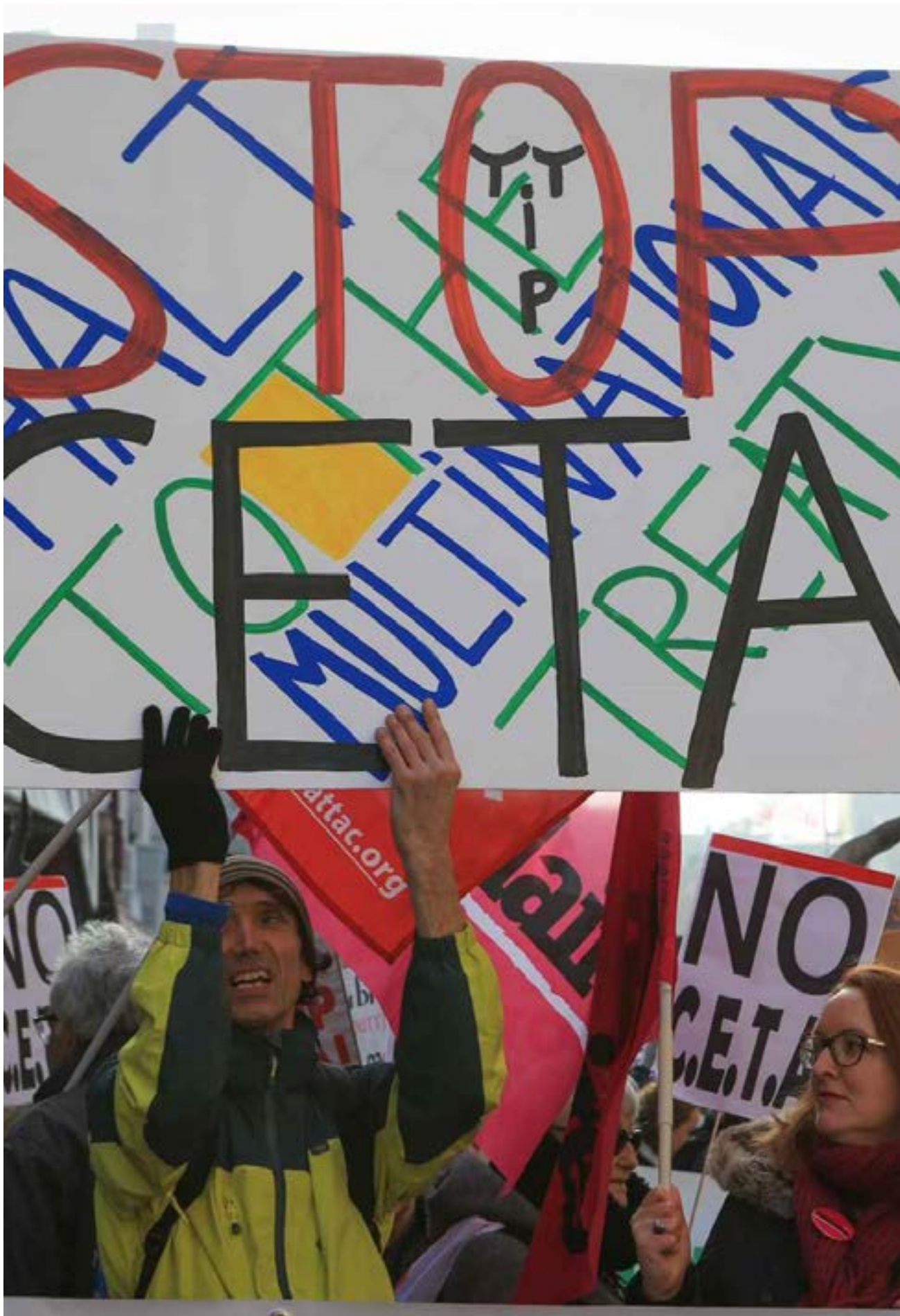
Manifestation devant le Parlement européen à Strasbourg avant le vote sur le Ceta le 15 février 2017.